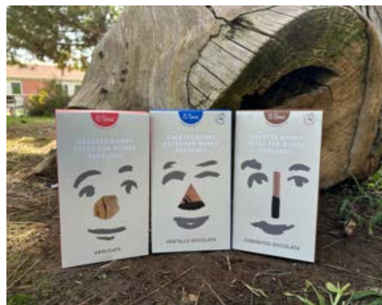
Galletas y arrugats artesanos Elaborados por el proyecto El Rosal.