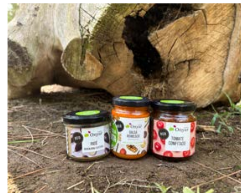
Salsas y patés Productos ecológicos de Onyar.