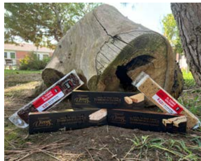
Variedad de turrónes Blandos y duros, de Torróns Vicens.