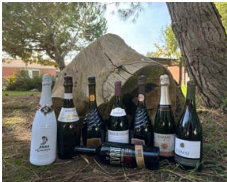
Vino, cava y vermut De la bodega Raimat y Codorníu.