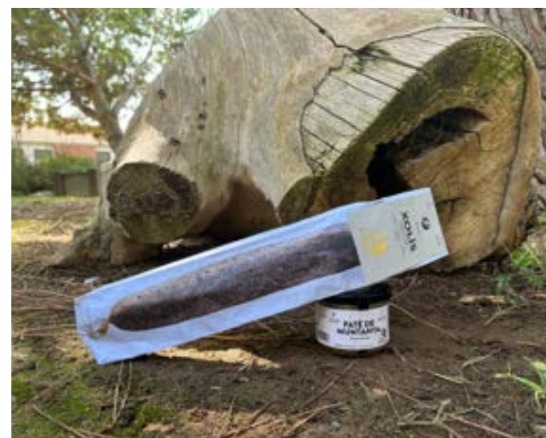
Longaniza y paté de montaña Productos ecológicos de Cal Tomàs.