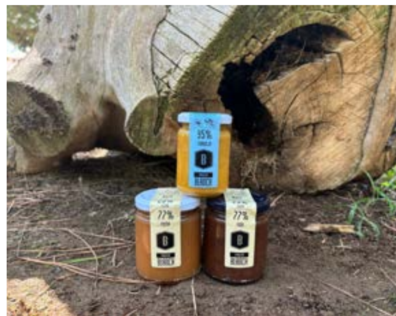
Mermeladas artesanales De manzana, naranja e higo, de Blanch.