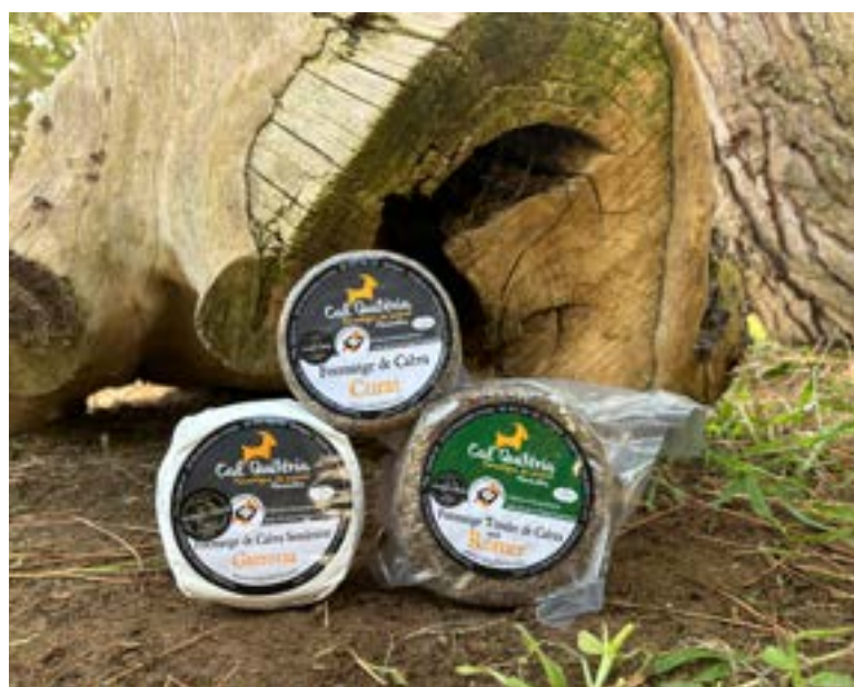
Quesos artesanos Elaborados por Cal Quitèria.