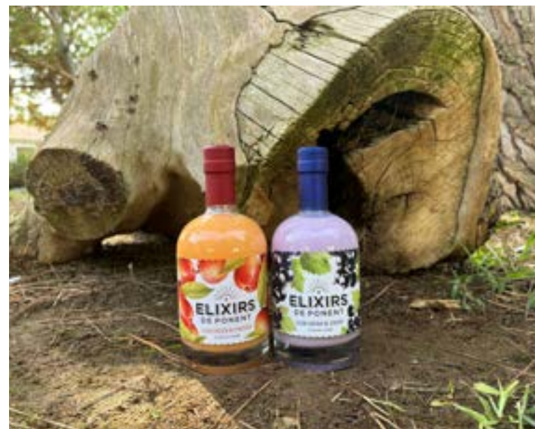
Cremas y licores De la empresa Exilirs de Ponent.