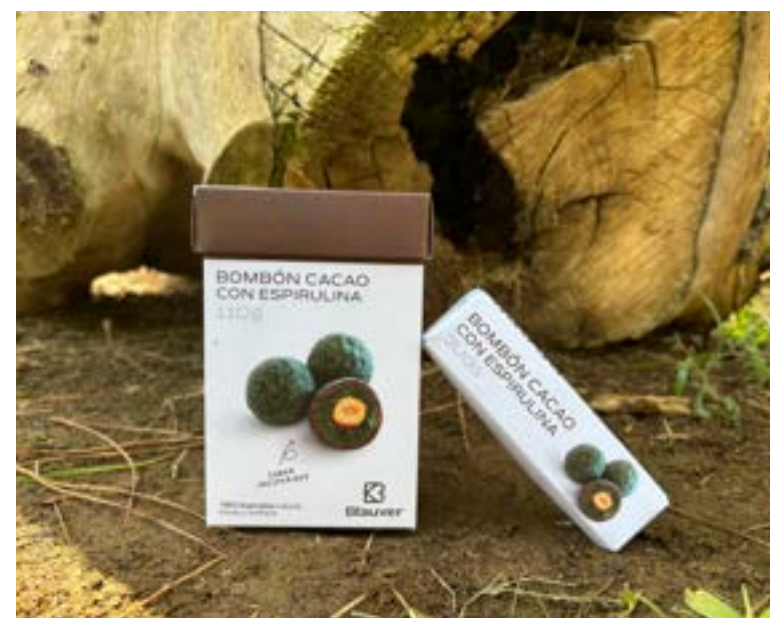
Bombón con espirulina Elaborados por Blauver.