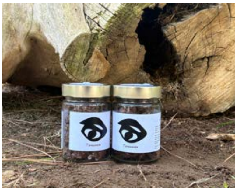
Tomassets de chocolate y patatas chips Elaborados por la fundación Sant Tomàs.