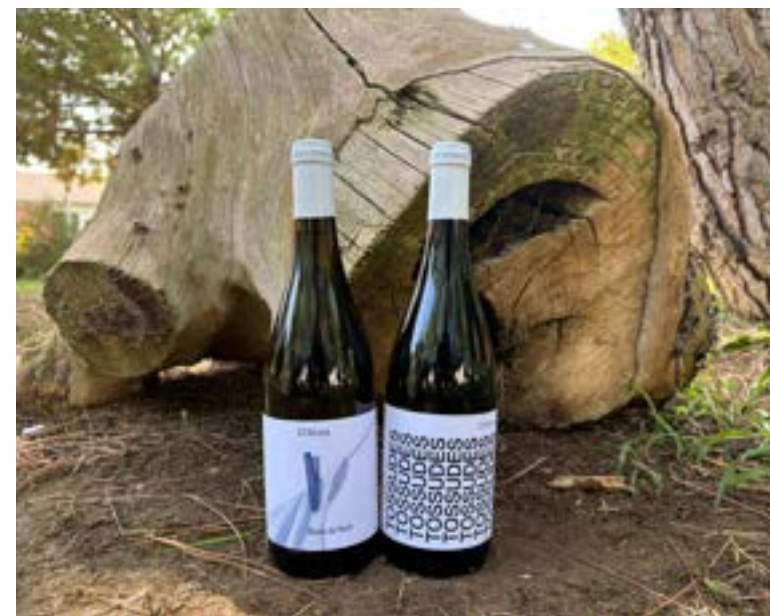
Vino de agricultura ecológica Elaborados por la cooperativa L'Olivera.