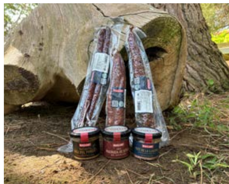
Fuets, longanizas y patés Elaborados por Mallart, de Mas Albornà.