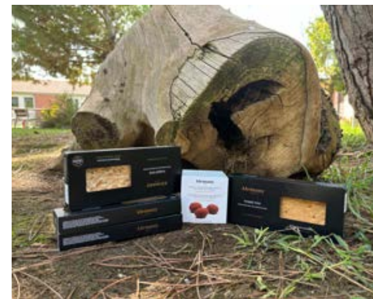
Turrónes y dulces Elaborados por la empresa Alemany.