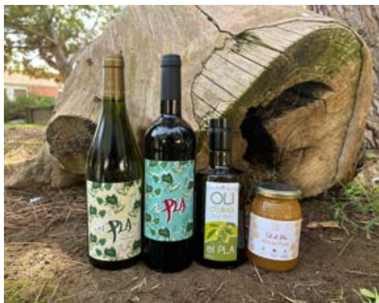
Vino, aceite y miel de proximidad Los productos de CET El Pla.