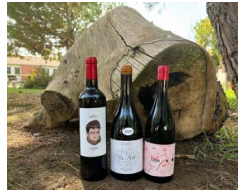
Vino de agricultura sostenible Elaborados por la bodega Lagravera.